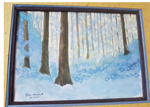
Aquarelle d'Elie Foucault

L'association 1, 2, 3 cadres vous présente ses créations réalisées dans son atelier de Noyers, accompagnées des aquarelles d'Elie FOUCAULT.