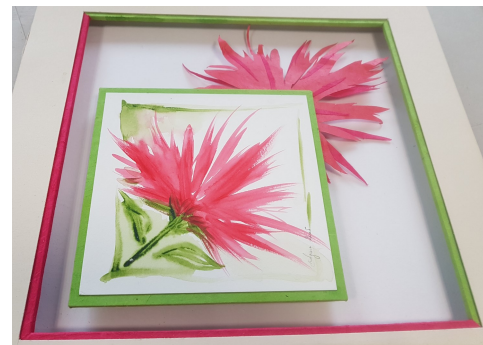
Encadrement de l'association