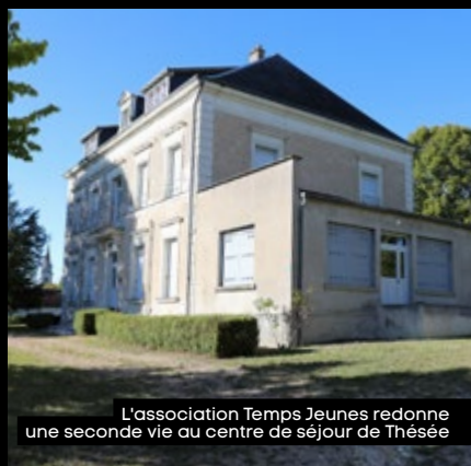
L'association Temps Jeunes redonne une seconde vie au centre de séjour de Thésée