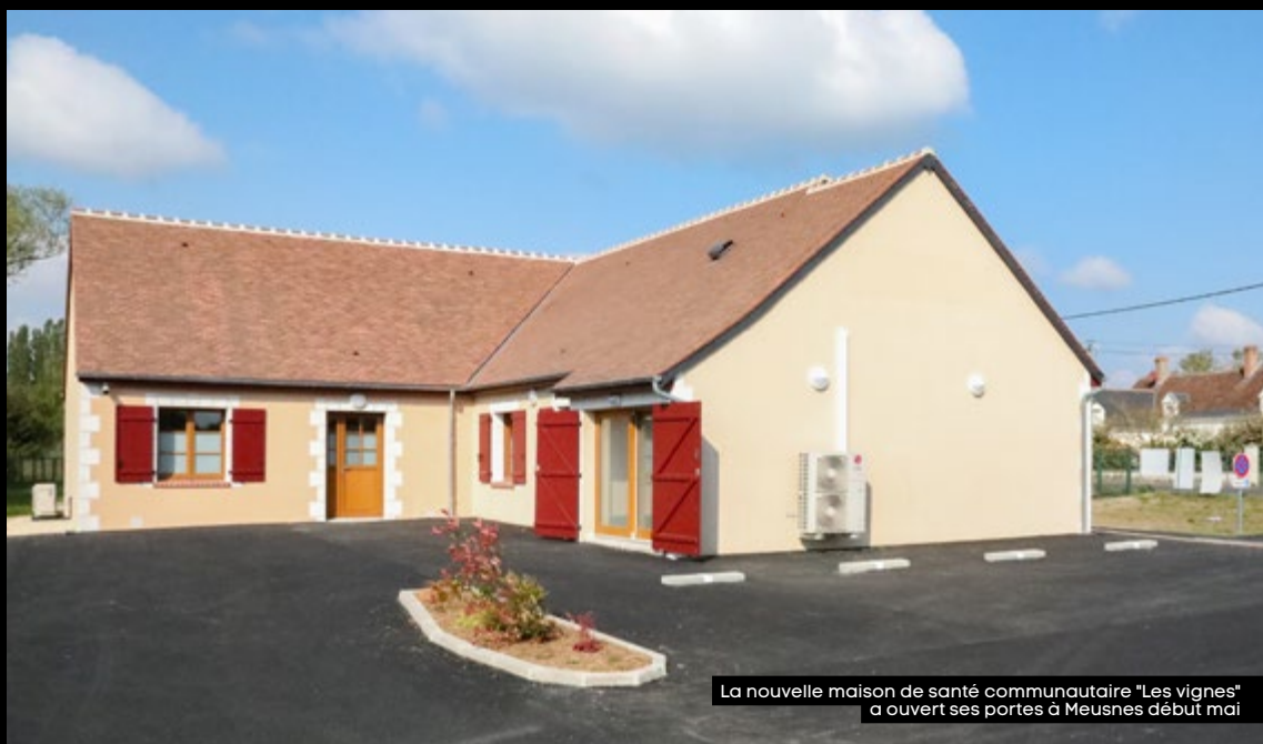
La nouvelle maison de santé communautaire "Les vignes" a ouvert ses portes à Meusnes début mai