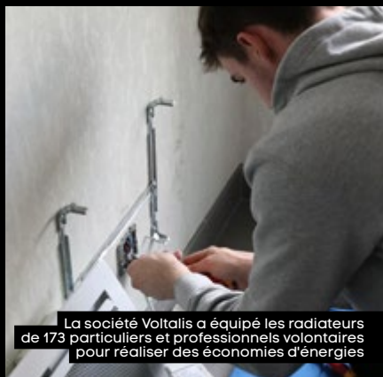
La société Voltalis a équipé les radiateurs de 173 particuliers et professionnels volontaires pour réaliser des économies d'énergies