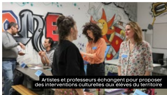
Artistes et professeurs échangent pour proposer des interventions culturelles aux élèves du territoire