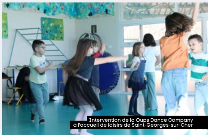
Intervention de la Oops Dance Company à l'accueil de loisirs de Saint-Georges-sur-Cher

Pour former les jeunes à l'animation, le Val de Cher Controis a mis en place le BAFA Territoire. En partenariat avec la Ligue de l'enseignement, 250 jeunes ont été formés depuis 2012. Contrepartie de l'aide financière communautaire, les jeunes interviennent dans les centres de loisirs durant leurs trois semaines de stage.