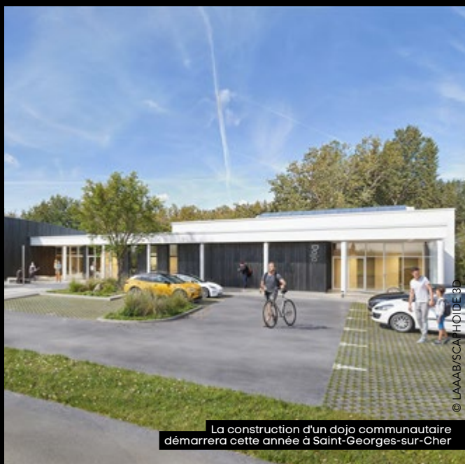
La construction d'un dojo communautaire démarrera cette année à Saint-Georges-sur-Cher