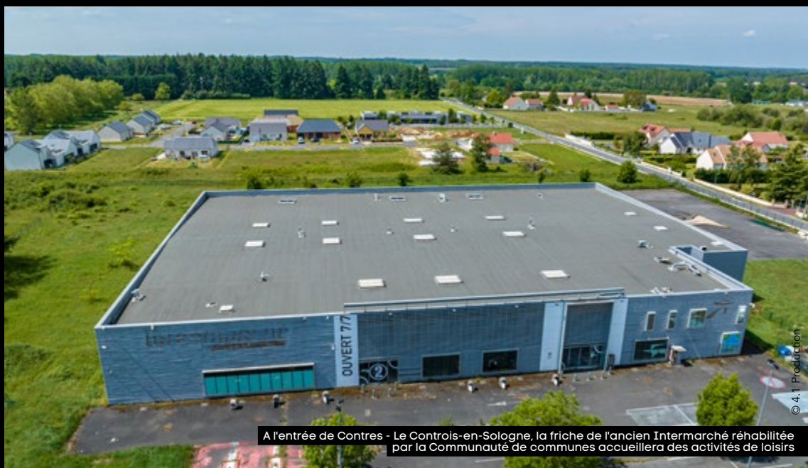
A l'entrée de Contres - Le Contres-en-Sologne, la friche de l'ancien Intermarché réhabilitée par la Communauté de communes accueillera des activités de loisirs