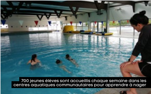
700 jeunes élèves sont accueillis chaque semaine dans les centres aquatiques communautaires pour apprendre à nager