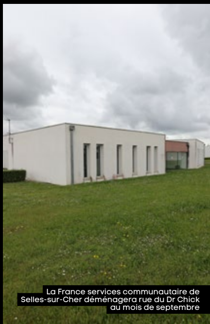
La France services communautaire de Selles-sur-Cher déménagera rue du Dr Chick au mois de septembre