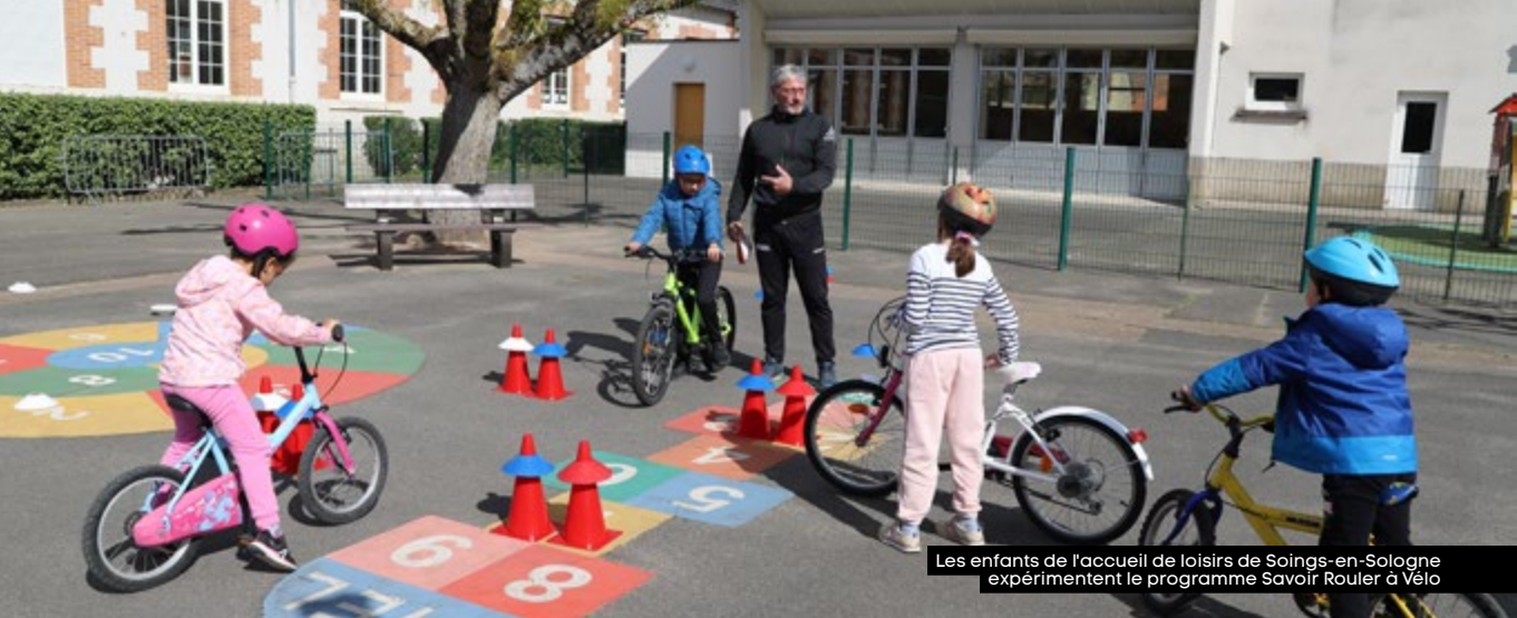
Les enfants de l'accueil de loisirs de Soings-en-Sologne expérimentent le programme Savoir Rouler à Vélo