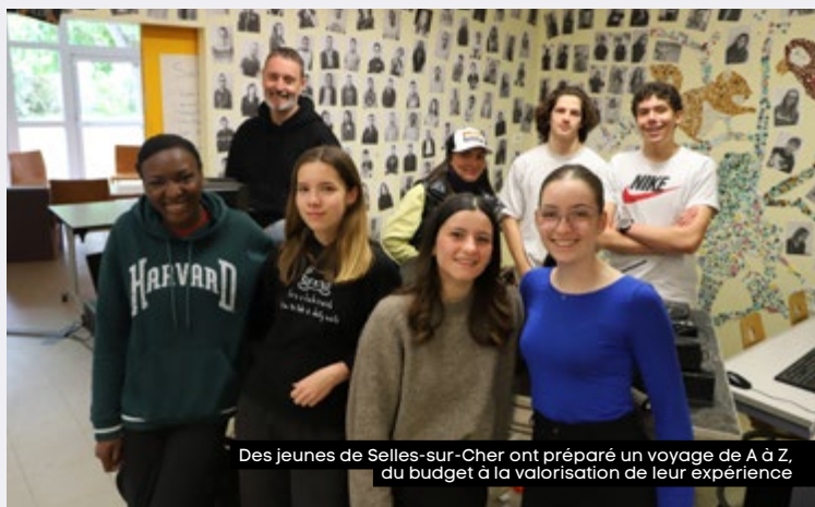
Des jeunes de Selles-sur-Cher ont préparé un voyage de A à Z, du budget à la valorisation de leur expérience

Lieu de rencontres, d'apprentissages et d'émancipation, l'Espace Jeunes de Selles-sur-Cher accueille les 11-17 ans tout au long de l'année pour de nombreuses activités sportives, culturelles ou la réalisation de projets collectifs. Illustration avec le voyage en Croatie du 27 juillet au 4 août prochain dont nous vous présentons les étapes.