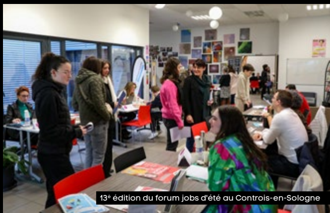
13 e édition du forum jobs d'été au Contres-en-Sologne