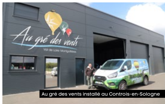
Au gré des vents installé au Controis-en-Sologne

Décollage réussi pour la société de vol en ballon controise. Installée dans de nouveaux locaux depuis octobre dernier, elle poursuit son développement sur un marché en croissance.