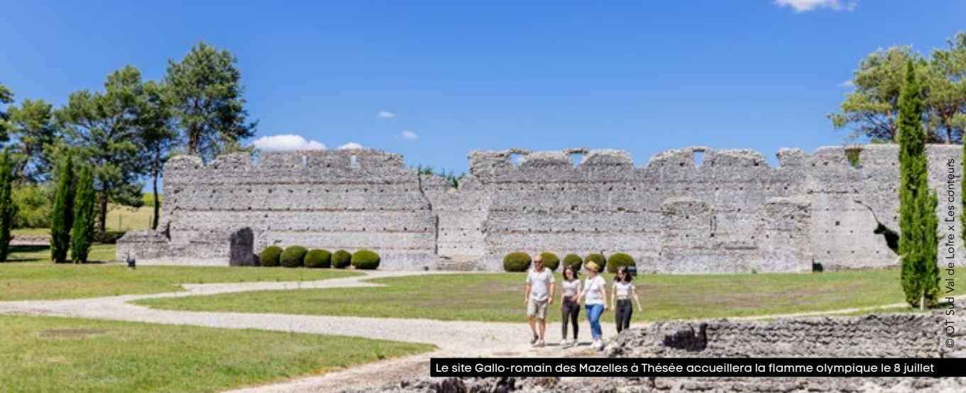
Le site Gallo-romain des Mazelles à Thésée accueillera la flamme olympique le 8 juillet