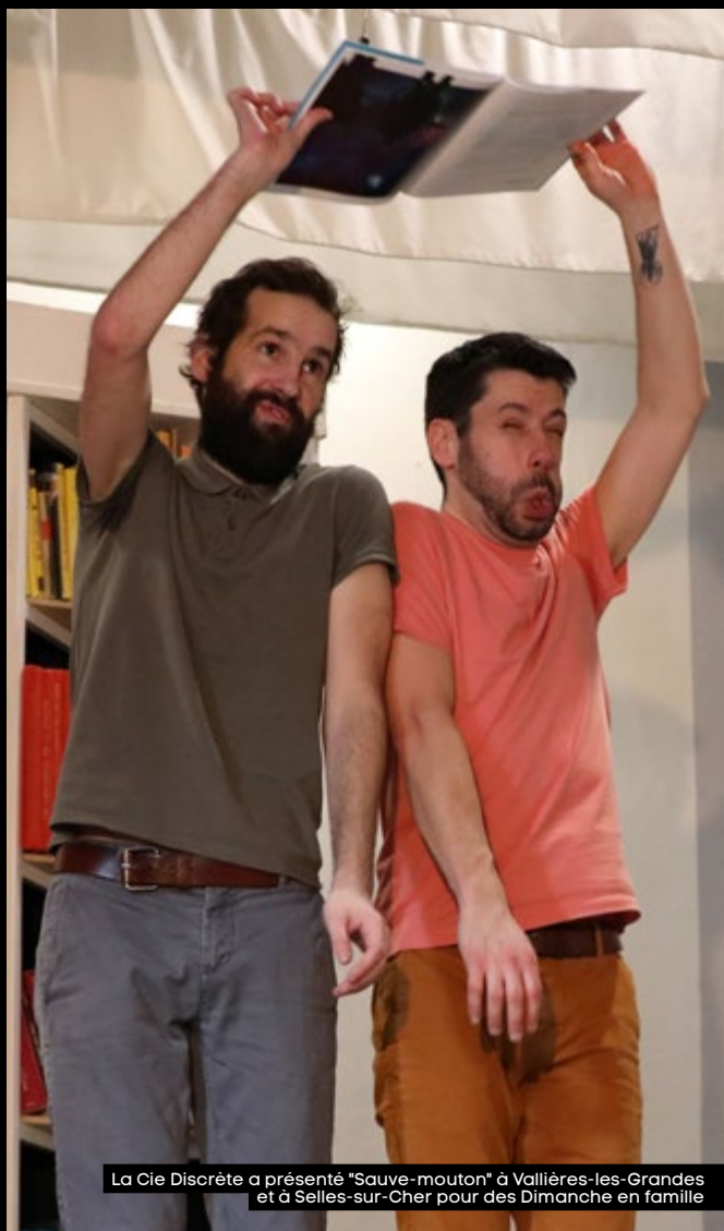
La Cie Discrète a présenté "Sauve-mouton" à Vallières-les-Grandes et à Selles-sur-Cher pour des Dimanche en famille